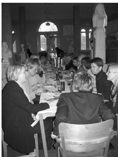
Årsmötet avslutades med middag.