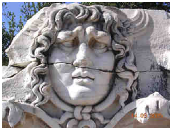
Medusa i Didyma.

Med vår buss åker vi till den välbevarade staden Priene från Alexander den stores tid och vidare mot Miletos för att besöka den överdådiga teatern. Vi avslutar vår utflykt med att se det stora orakel-templet tillägnat Apollon. Bussen tar oss sedan den korta sträckan ner till staden Altinkum, där våra båtar ankrat upp. De är moderna turkiska ca 25 meter långa motorkryssare byggda i traditionell stil av furu och benämns guleter. Vi äter lunch på egen hand i Altinkum och blir sedan hämtade av passbåtar med vår packning. Vi installerar oss ombord och får även möjlighet att ägna tid på soldäck och bada i det kristallklara vattnet. Båtarna går till en liten skyddad naturhamn för natten. Gemensam middag ombord.