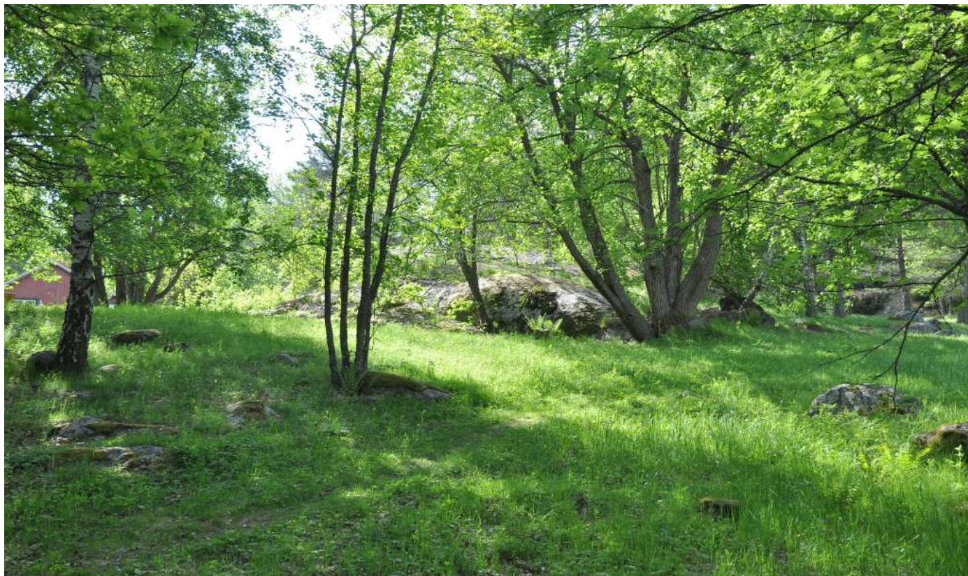
Här återfanns ett ca. 1 m tjockt kulturlager med massor av brödfynd, kirugiska instrument mm. och på vilken senare i vikingatid lades en treudd.

verkscentrum med vidsträckta handelskontakter. Bronsgjutningen med egentillverkade produkter visar kontakter med hela det Baltisk-Bottniska området. Det finns forskare som ansett Helgö vara en centralort, en handelsplats i Mälaren och hänvisat till de rika fynden i byggnadsgrupp 2 men även de stora kvantiteter verkstadsfynd, som påträffades i husgrupp 3.